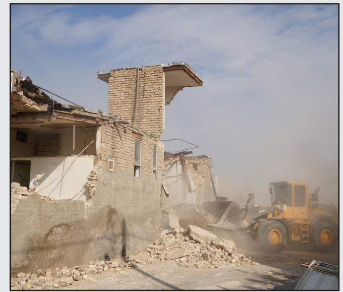
توافق، تخریب و آزادسازی در خیابان شهدای جوی آباد