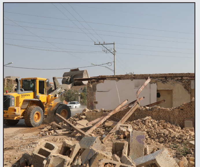
توافق، تخریب و آزادسازی در خیابان بسیج دستگرد

در گفتگوی فرصت با مدیرعامل سازمان حمل و نقل