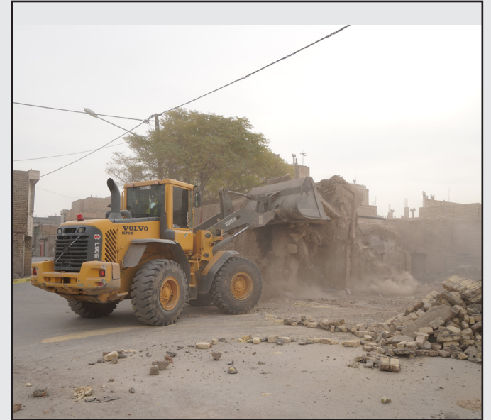
توافق، تخریب و آزادسازی در خیابان ۱۶ متری اسفریز