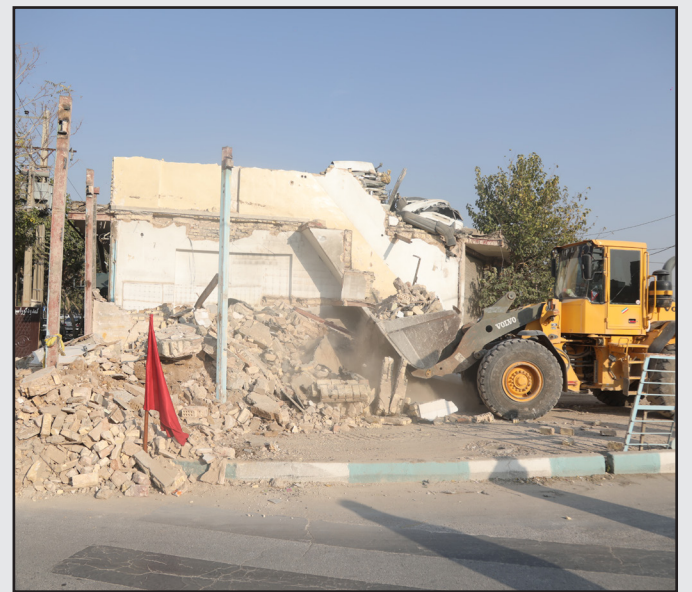
توافق، تخریب و آزادسازی در ورودی بلوار شهدای مدافع حرم به امیر کبیر